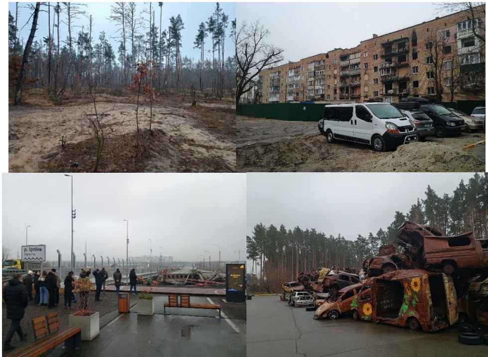
Рис. 1. Дослідження Бучанського району Київської області

жертв окупації та оборонців селища, що забезпечує поєднання відбудови з фіксацією історичної правди про пережиті події.