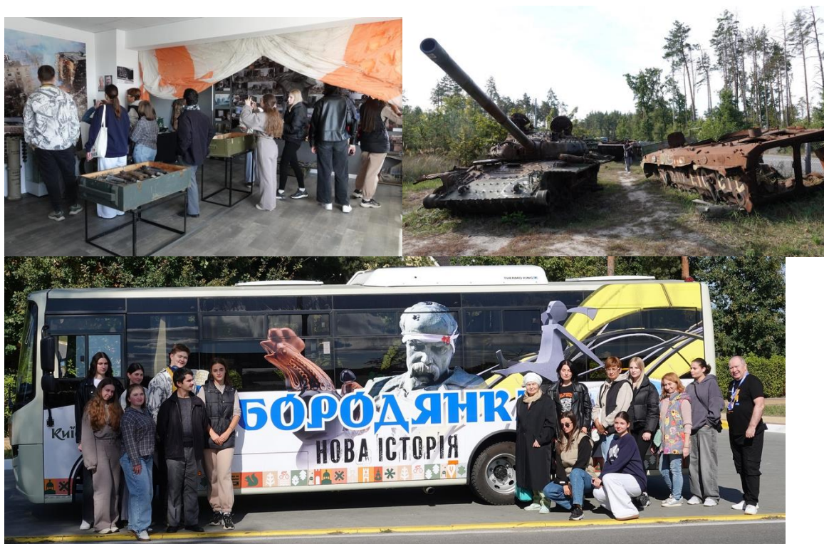
Рис. 2. Волонтерський екскурсійний тур пам'яті