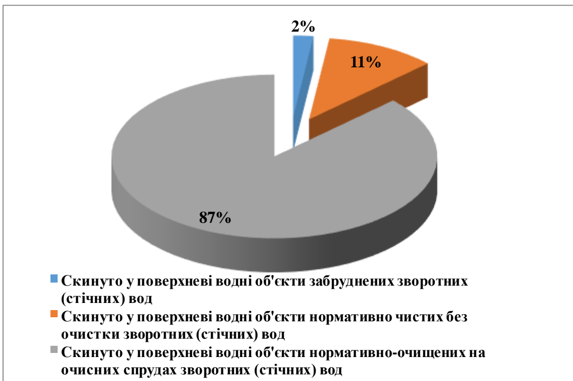
Рис. 3. Структура скидання зворотних (стічних) вод у поверхневі водні об'єкти басейну річки Серет, за 2024 рік

Тернопільщини, 2011), то коефіцієнт водовідведення, розрахований за формулою 8, для басейну річки Серет, становитиме: K_{\text{вв}} = 300\,000\text{ м}^3 / 382\,000\,000\text{ м}^3 = 0,0008 .